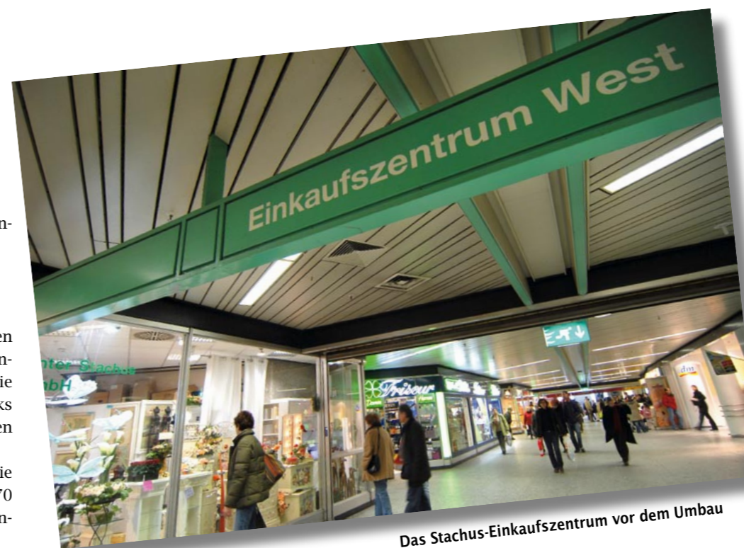
Das Stachus-Einkaufszentrum vor dem Umbau